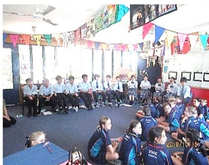
オーストラリア研修