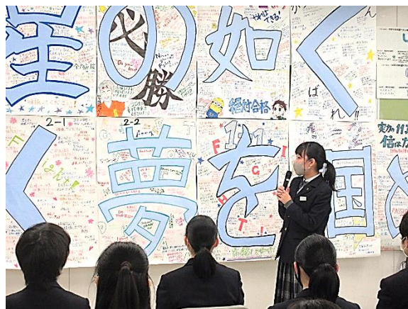
生徒代表誓いの言葉