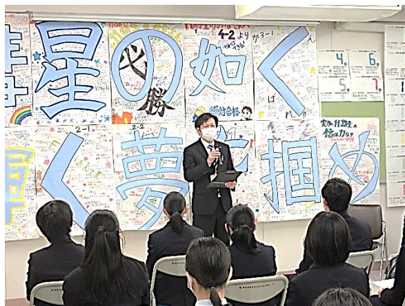
校長先生激励の言葉